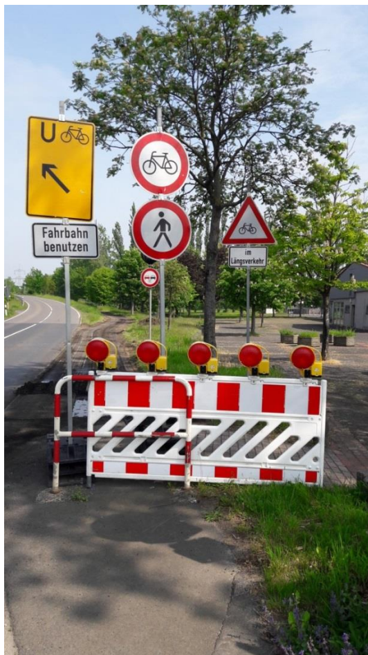
Sperrbeschilderung im Bereich Dörnhausen