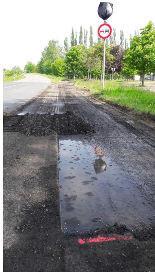
Beginn der Sanierungsarbeiten im Bereich Dörnhausen